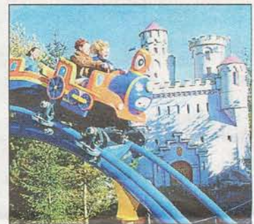
Hier kann man der Schwerkraft ein Schnippchen schlagen.