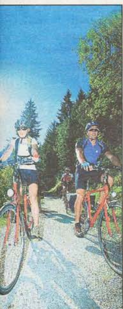
Die Tour führt die Genussschwärmer durch den Pongau. SLT

Erfahren Sie die schönsten Eindrücke entlang der Salzach zwischen Bischofshofen und Schwarzach. Beim GenussRadln von Salzburger Landwirtschaft und ORF Radio Salzburg kann man am Sonntag auf einer einfachen Tour mit rund 25 Kilometern die einmalige Landschaft im Pongau kennenlernen, dabei warten entlang der Strecke jede Menge kulinarische Genüsse. Ausgesuchte landwirtschaftliche Partnerbetriebe kredenzen regionale Salzburger Schmankerln.